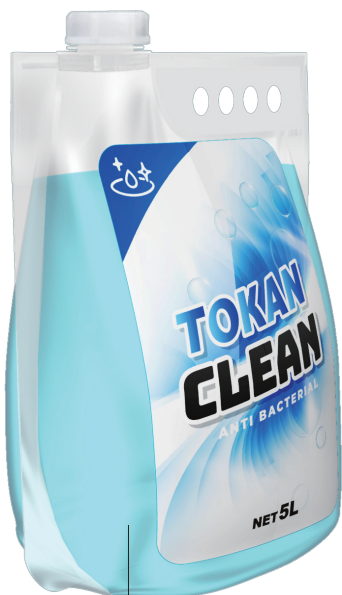
印刷・ラベル貼り可能