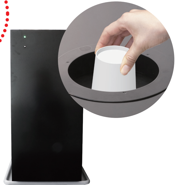
TOKAN使用済みコップ洗浄機 Re-CUP WASHER