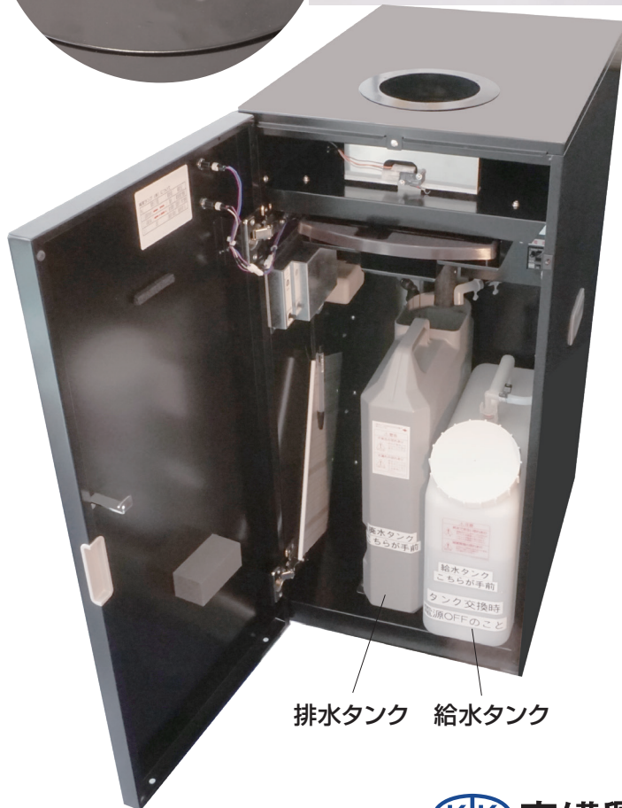
排水タンク 給水タンク