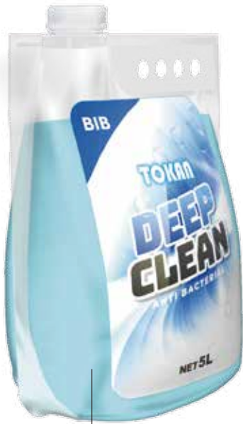
印刷・ラベル貼り可能