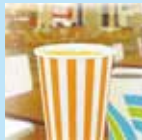
一般紙コップ (マニュアル用)