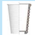
断熱性エンボス 紙コップ