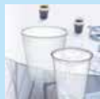
PS・PPコップ (プラストコップ)