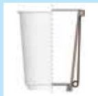
断熱性エアウォール 紙コップ