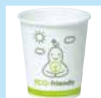
環境配慮型紙コップ