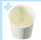
バリウム用コップ