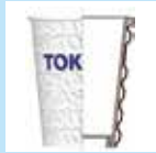
モーグル紙コップ